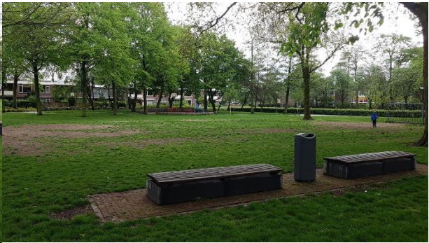
Foto 4 van ombudsman, gehele trapveldje en andere doel