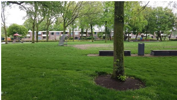
Foto 3 van ombudsman, voor het ene doel