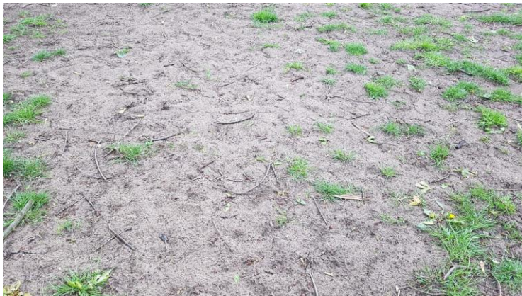
Foto 5 van ombudsman, zand voor het linker doel