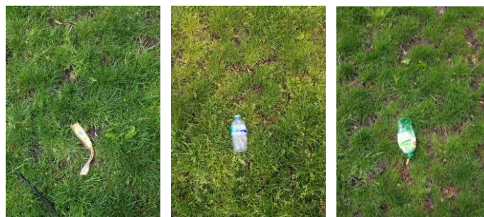
Foto's 7, 8 en 9 van ombudsman, plastic zwerfvuil

Op het zand voor de doelen van het trapveldje lag geen glas of puin. Op het grasgedeelte van het trapveldje lag evenmin glas of puin. Op het overige gedeelte van het grasveld lag evenmin glas of puin, wel plastic zwerfvuil.