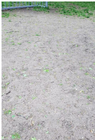
zand voor het rechter doel