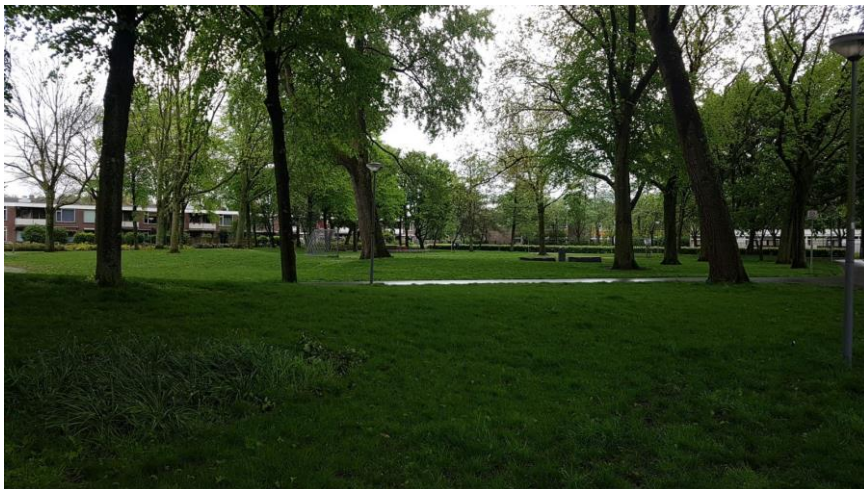
Foto 2 van ombudsman, overzichtsfoto vanaf het Geelkruid

Uit foto 2 blijkt dat het gras er over het algemeen groen bij ligt. Alleen op het trapveldje is het gras vooral voor de doelen weggesleten.