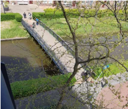
Foto van de ombudsman, de brug gezien vanaf het balkon bij de woning van de heer L.

25. Omdat de heer L. vooral klaagt over overlast van skates, skateboards en stepjes