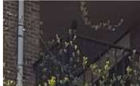
Foto van ombudsman, balkon van de heer L. met microfoon van Valersi

29. Valersi plaatste een microfoon op de hoek van het balkon van de heer L. De heer L. houdt vanaf 30 april 2018 een logboek bij voor Valersi. Daarin schrijft hij op wat hij wanneer hoort. Na de meetperiode stuurt hij dit logboek naar Valersi.