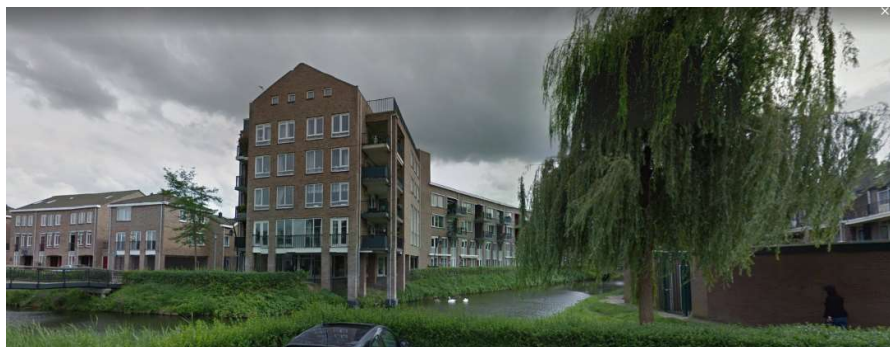
aanzicht appartementencomplex waar de heer L. woont