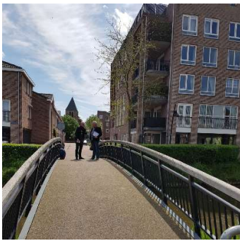
Foto van de ombudsman, de voetgangersbrug over de Boezem in de richting van de Vaartstraat met rechts het appartementencomplex waar de heer L. woont