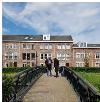
Foto van de ombudsman, de voetgangersbrug over de Boezem vanuit de Vaartstraat met de woningen tegenover het appartement van de heer L.