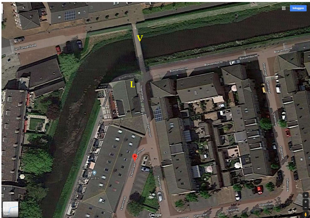
Printscreen van Google © op 19 november 2019, appartementencomplex waar de heer L. woont.